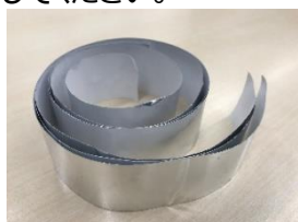
封印テープ（粘着テープ）