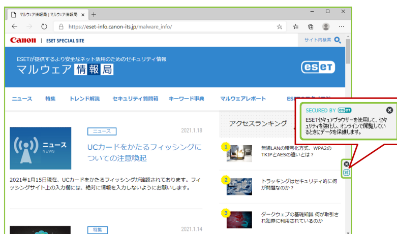
セキュアブラウザ利用時の画面イメージ

※1 Internet Explorer、Microsoft Edge、Google Chrome、Mozilla Firefox に対応します。セキュアブラウザは ESET Endpoint Security に搭載されています。