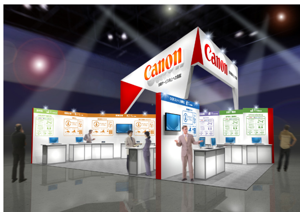
キヤノンブース(イメージ)

キヤノンマーケティングジャパン株式会社(代表取締役社長:坂田正弘、以下キヤノン MJ)は、2019年10月24日(木)から25日(金)に開催される日本金融通信社主催の国内最大の金融機関向け IT フェア「FIT2019 金融国際情報技術展」に出展します。