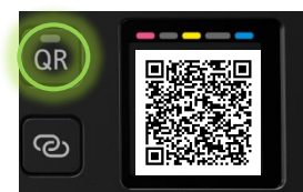
QRコードボタン（イメージ）