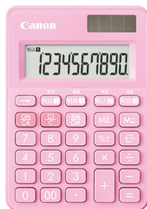
ストロベリーピンク