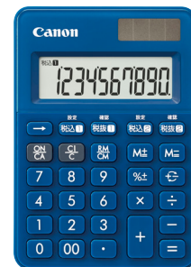
ミッドナイトブルー