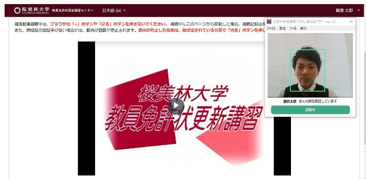
「教員免許状更新講習システム」画面イメージ

2009年4月1日に教員免許状更新制が導入されて以降今年で10年が経過しました。教員免許状更新制は、その時々で求められる教員として必要な資質能力が保持されるよう、定期的に最新の知識技能を身に付けることを目的に始められた制度です。