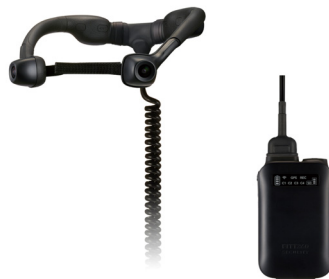
LINKFLOW FITT360 SECURITY