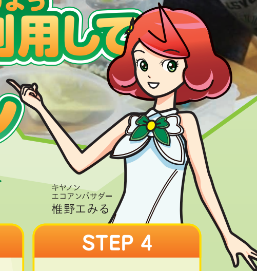
キャンノン エコアンバサダー 椎野みくる