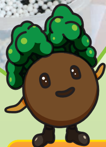
キャンノン エコアンバサダー 土男