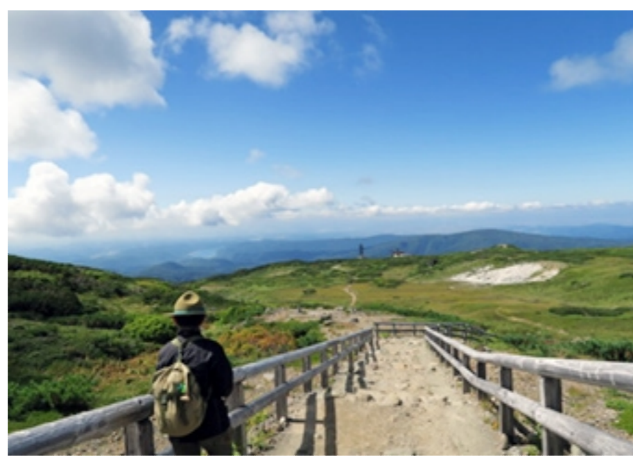
大雪山国立公園の風景