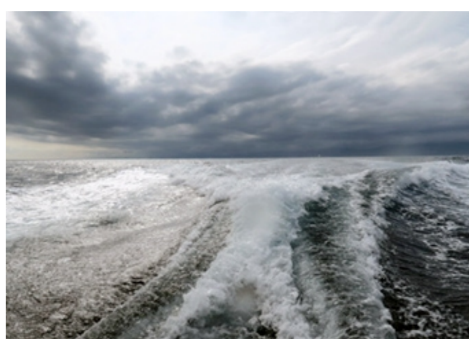
船から見たオホーツク海