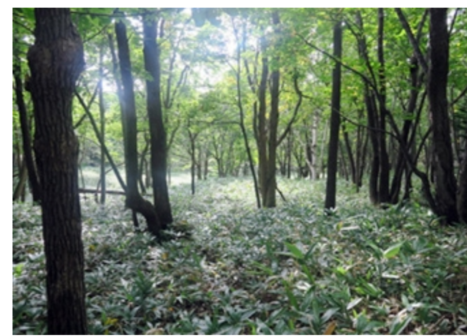
知床国立公園（ウトロ地区）の風景