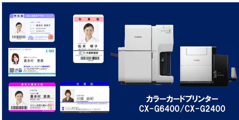
カラーカードプリンター CX-G6400/CX-G2400

キヤノン カラーカードプリンター CX-G6400/CX-G2400の印字サンプルを ぜひ手に取って、その印字品位を実感 してください!