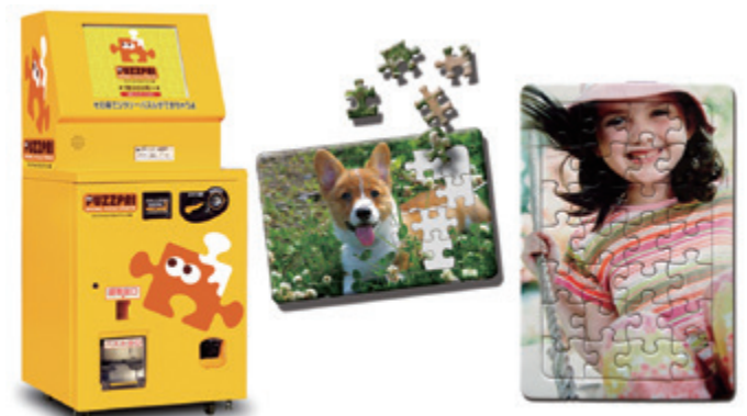
パズルプリント機 パズプリ2

メンテナンスでの工夫は、全てキヤノンITソリューションズからの提案です。かゆいところに手が届く提案をしてもらえたので、スムーズなメンテナンス作業が可能となりました」