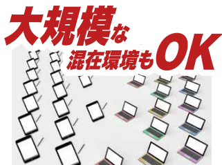
大規模な 混在環境もOK iPad、Windowsが混在する大きな組織でも安心してお使いいただけます。