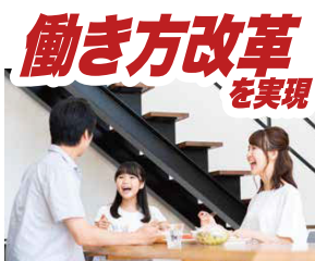
働き方改革 を実現 無駄な移動時間が削減され生産性の向上と時短を実現。従業員のプライベートも充実できます。