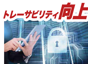
トレーサビリティ向上 誰がいつ書き込みをしたのか記録が残るので、機密文書の管理を高度化できます。