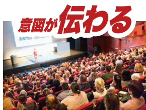
意図が伝わる リアルタイム共有により詳細な文書を手元で確認できるので、発言者の意図がしっかり伝わります。