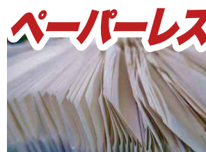
ペーパーレス 書類のコピーを大幅削減。機密保持に要する溶解費も削減でき、環境問題にも貢献します。