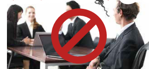
情報共有の質とスピードが劇的に改善するので、会議の数を減らすことができます。