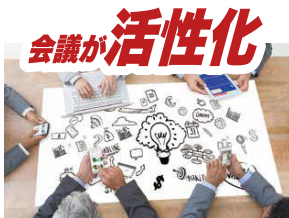
会議が活性化 複数人での双方向の書き込みがリアルタイムで伝わるので、プレストでのアイデアも湧き出てきます。