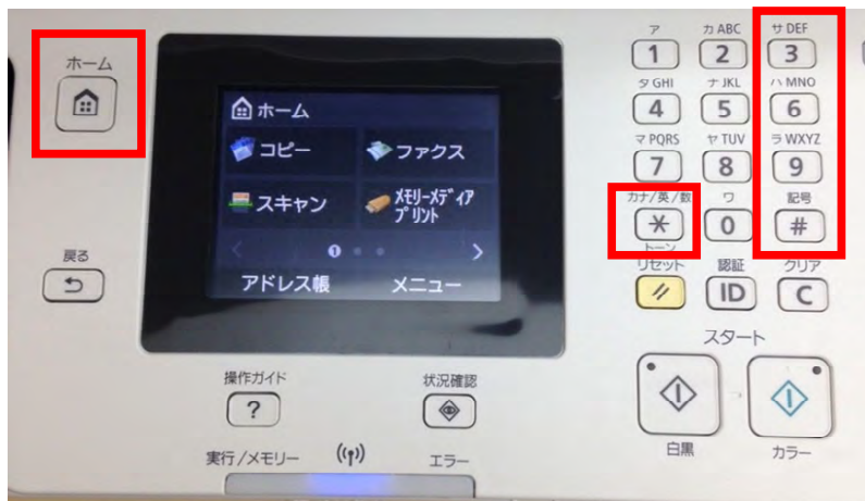
写真は MF726Cdw です。

1.2.1 “ホーム”キー押下後、“#”→“3”→“6”→“9”→“*”キーの順にボタンを押下します。