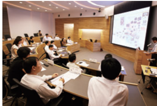
東京セミナー中国版