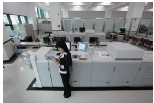
上海郵便局内でキャノンのデジタルプロダクションプリンターを使用

キャノンは、2010年に開催された上海万博において、上海郵政局が実施した、はがき・切手シートのカスタマイズ印刷サービスをサポートしました。これは、来場者が自分で撮影した写真を使用して、オリジナルのはがきや切手シートが作成できるサービス。印刷にはキャノンのデジタルプロダクションプリンターが使用されました。