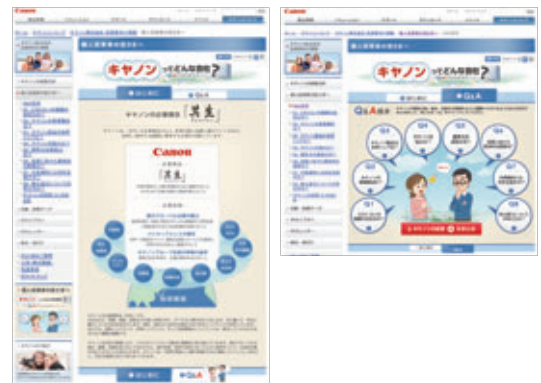
「投資家向け情報 個人投資家の皆さまへ」サイト画面

リニューアルにあたっては情報整理とナビゲーションに重点を置き、経営方針や投資家説明会など、投資家の関心の高い情報にアクセスしやすいよう工夫しました。また、個人投資家の方々の疑問に答えるため、企業理解のためのコンテンツを充実させました。