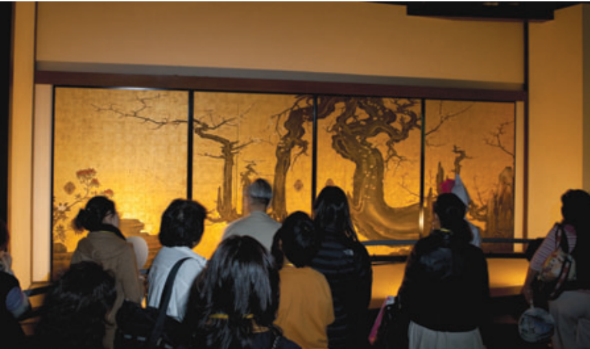
上海万博で綴プロジェクトの高精細複製品3作品を展示協力

「綴プロジェクト」を推進しています。キャノンの最新のデジタル技術と京都伝統工芸の技との融合により、オリジナルの文化財に限りなく近い高精細複製品を制作。「2010年上海国際博覧会」(「上海万博」)の日本館では、国宝「風神雷神図屏風」などの高精細複製品3作品の展示協力を行いました。