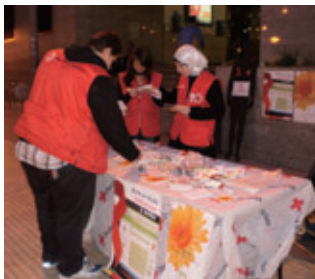
スペイン赤十字社のHIV/AIDSに関する情報提供・教育活動プログラム

2010年も、青少年を対象としたHIV/AIDSに関する情報提供・教育活動プログラム(スペイン赤十字社)や、貧困・移民差別などに苦しむ青少年を対象としたポジティブイメージ教育プログラム(英国赤十字社)などを支援しました。