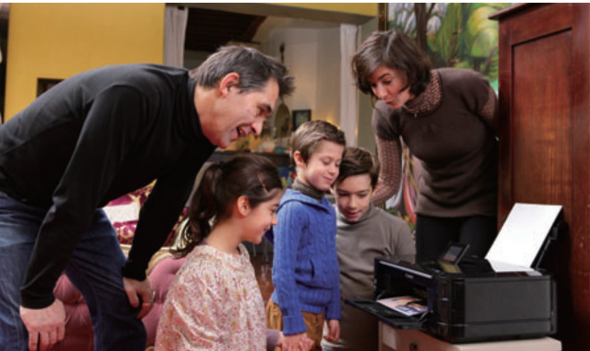
ユニバーサルデザインを追求したインクジェットプリンター「PIXUS MG6130」