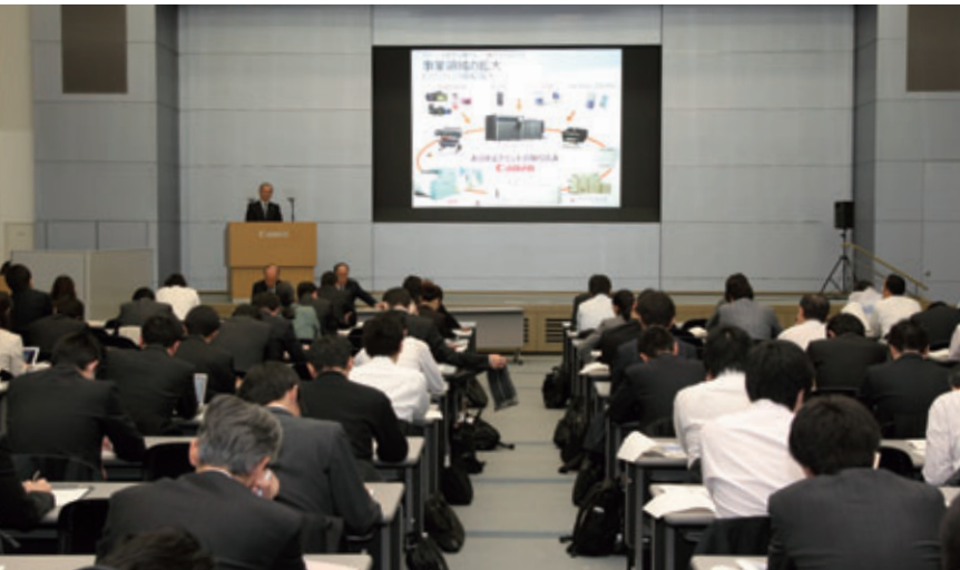
機関投資家向け経営方針説明会で、経営方針や戦略を説明