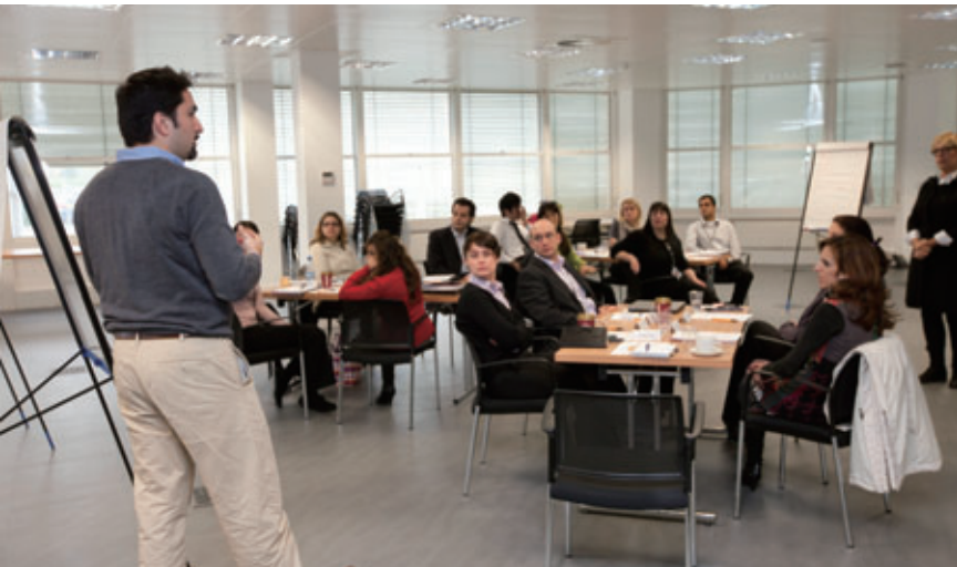
キヤノンヨーロッパで異文化交流研修を実施