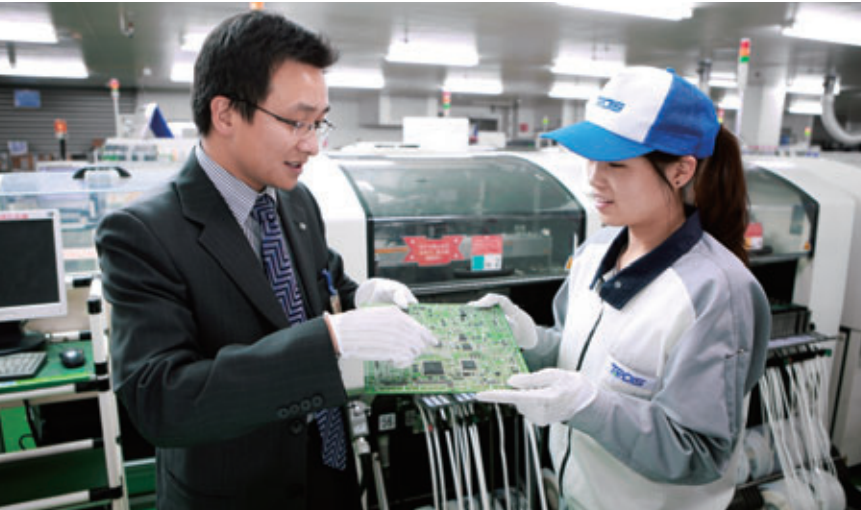
サプライヤーとの対話を深め、協力関係を強化