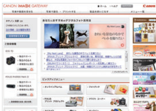
「CANON iMAGE GATEWAY」サイト画面

また、日本では、Webサイト上でオリジナルのフォトブックの制作から、公開、印刷、配送までの“出版体験”を提供するオンラインフォトサービス「PHOTOPRESSO (フォトプレzzo)」をスタート。今後は日本以外にも展開していく予定です。