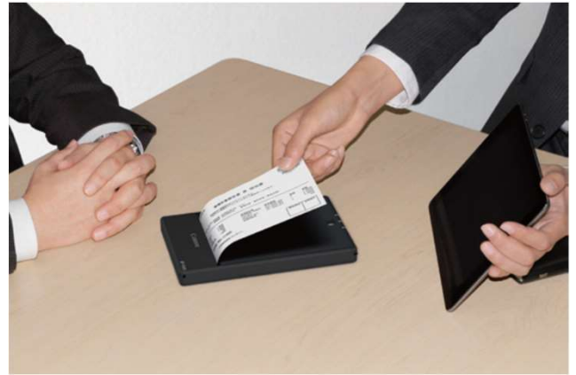
各種スマートデバイスに対応。外出先でワイヤレス印刷。