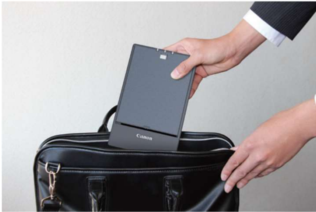
薄型の軽量ボディを実現。カバンの中にスッキリ収納。

※ 記載された仕様は、改良のため予告なく変更する場合がありますので予めご了承ください。