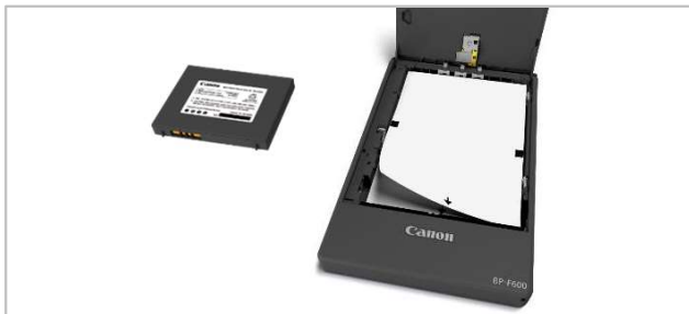
外出前の用紙補充でお客様先での用紙切れ・補充作業を回避。 外出先でのバッテリー交換にも対応。(別途購入が必要です)