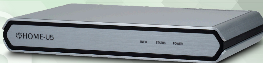
統合型脅威管理 (UTM) 装置 HOME-UNIT5